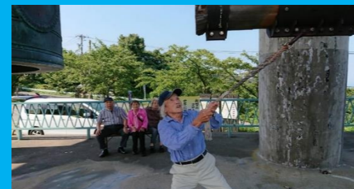
○二上山万葉ライン